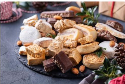
Ýmsir eftirréttir og snakk sem er í boði á jólum. Á myndinni eru ýmsar gerðri sætinda (turrón, polvorones, mazapán)

Dagarnir 24. og 25. desember eru með þeim vinsælustu. Fjölskyldur hittast að kvöldi 24. og borða kvöldmat. Það er mjög algengt að eyða síðdeginu við að undirbúa ýmsa sérretti sem tekur langan tíma að útbúa. Venjulega er boðið upp á þrjá til fjóra rétti. Lystauka, sjávarréttir kjöt og alls konar eftirrétti (turrón, polvorones, mazapán).