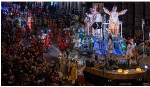
Konungarnir þrír fara um götur borgarinnar og dreifa sælgæti