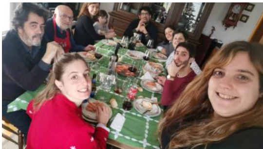
Fjölskylda Sabelu í jólaveislu. Hún er lengst til hægri á myndinni

Daginn eftir safnast fjölskyldan saman og borðar hádegisverð. Venjulega eru það afgangar frá kvöldinu áður og kannski einn nýr réttur.