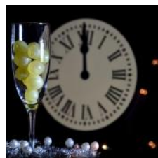
Vínberin bíða eftir miðnætti

Til þess að fagna áramótunum hittist fjölskyldan yfir kvöldmatnum með fjölbreyttum réttum líkt og á jólum. En að þessu sinni snýst allt um að undirbúa miðnætti. Fram að miðnætti fylgjast allir með í sjónvarpinu á meðan klukkan slær 12 slög. Það er hefð að hafa glas með 12 vínberjum fyrir framan sig og borða eitt ber fyrir hvert slag sem klukkan slær.