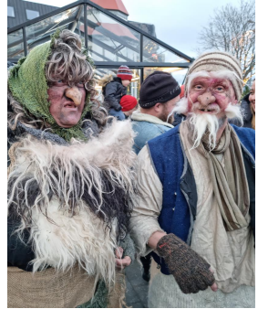
Skötuhiúin Grýla og Leppalúði fylgdust með af miklum áhuga

Jólakötturinn er óvættur í íslenskum þjóðsögum og er húsdýr hjá Grýlu og Leppalúða. Jólakötturinn er þekktur fyrir að éta börn sem ekki fá flukur fyrir jólin. Börnunum var til dæmis gefið kerti og einhverjar spjarir, sokk-ar eða skór, til þess að þau þyrftu ekki að klæða köttinn eins og sagt var. Í öðrum útgáfum frá sagnarinnar étur jólakötturinn matinn frá börnunum frekar en börnin sjálf. Og í enn öðrum gildir þetta jafnt um fullorðna.