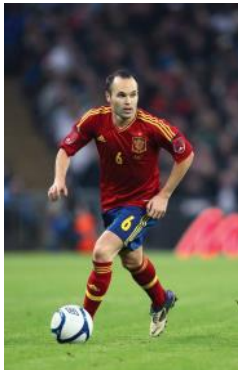
Andrés Iniesta lék 131 landsleik með Spáni

Tölfræði mánaðarins sýnir talsverða yfirburði stórliðanna tveggja sem spila El Clasico leikinn. Rétt er að taka fram að þegar Spánn varð heimsmeistari var leikmannahópur FC Barcelona stútfullur af leikmönnum úr La Masia. Spánn varð heimsmeistari 2010 en Barcelona vann Meistaradeildina 2009 og 2011. Þess má meðal annars geta að á HM 2006 áttu Liverpool FC og FC Barcelona jafnmarga fulltrúa í spænska landsliðinu eða þrjá. Já haft eftir sumum Katalónum; Katalónía er ekki Spánn! Peppe Reina og Luis Garcia leikmenn Liverpool áttu jafnframt sterka tengingu við Barcelona.