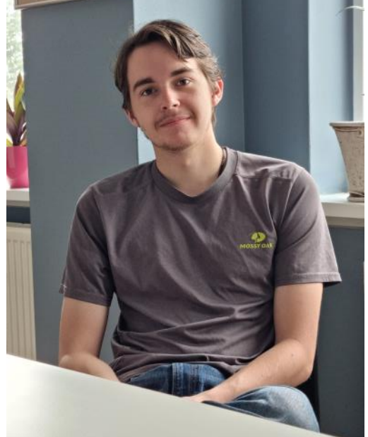
Will eins og hann er kallaður slakar á milli verka

Í framhaldi af því er ekki úr vegi að spyrja hvort honum finnist einhver munur á Íslendingum og Ameríkönnum og þá segir hann að honum finnist Íslendingar ganga mun meira en Amerikanarnir og segir að þeir noti meira bílinn!