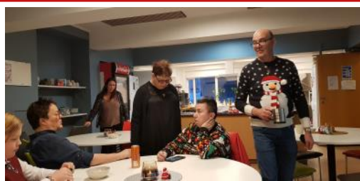
Litlu óveðursjólin 17. desember