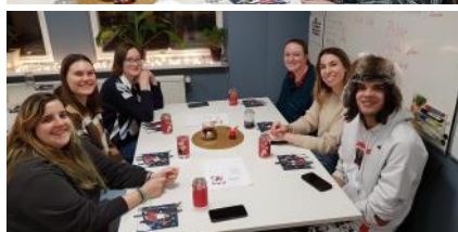
Jólaveislan 8. desember