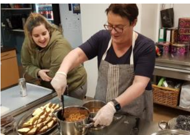
Skötuveislan á Porláksmessu