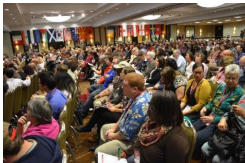
Myndin er tekin á ráðstefnunni í Baltimore 2022

Slíkt getur að sjálfsögðu komið til kastanna okkar sem tilheyrja Faculty for Clubhouse Development (Vottunarfundur). Eitt klúbbhús í New York er níu hæða. Engu að síður gilda sömu staðlar og hjá okkur í Skipholtinu.