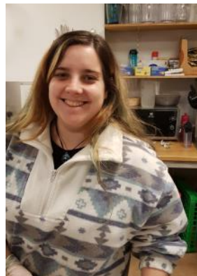
Sabela á góðum uppákomudegi í Geysi

Veðrið er sennilega það sem fólk varaði mig mest við. Augljóslega, þá er það sú staðreynd að sumarið er ekki heitt og veturinn er frekar kaldur, en aðallega þá var mér sagt frá vindinum. Fyrst skildi ég ekki af hverju enginn notar regnhlífir hérna. Núna skil ég það. Vindurinn kemur alls staðar frá og hann breytist á hverri sekúndu, þannig að ef það er rigning, þá er regnhlíf gagnslaus. Veðrið er yfirhöfuð þannig, það breytist stöðugt og þú veist aldrei við hverju má búast. Það er meira að segja orðalag um það: „Ef þú filar ekki veðrið, bíddu þá í 5 mínútur“.