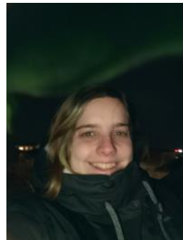
Sabela og norðurljósín

Aðalfundur Clubhouse Europe verður haldinn með fjarfundarbúnaði fimmtudaginn 23. mars kl. 14.00. Allir félagar hvattir til að mæta.