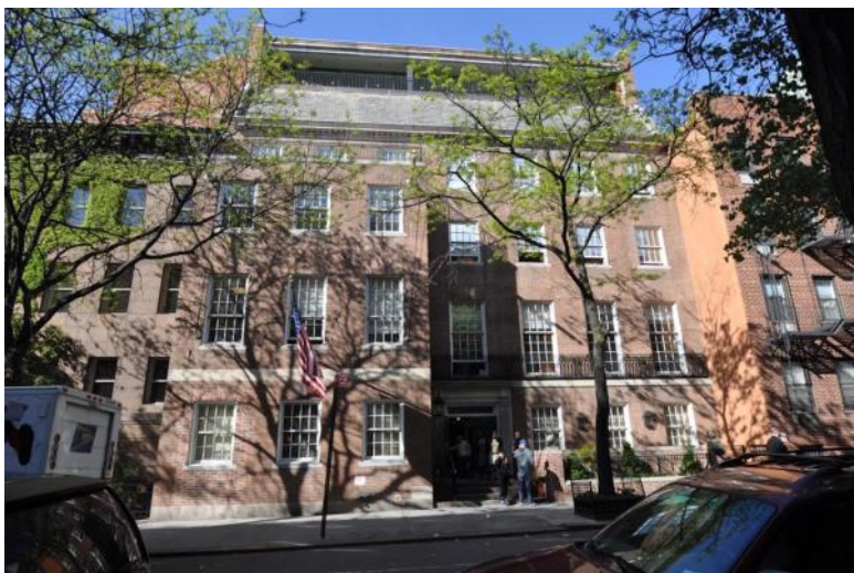
Fountain House 425 West 47th street New York

fréttatilkynningum, bauð fram ýmsan hagnýtan stuðning í þeim tilgangi að útvega húsnæði og atvinnu fyrir þá sem voru tilbúnir að útskrifast. Sjúklingum var einnig boðið að gerast félagar í WANA hópnunum við útskrift þar sem þeim gafst tækifæri til að eignast vini og finna