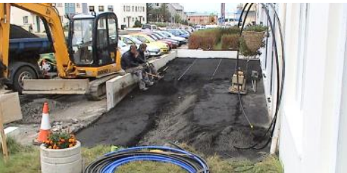
Frá framkvæmdum við ramp og sólpall árið 2004