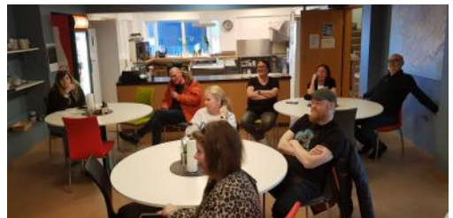
Áhugasamir félagar spá í stressorkun