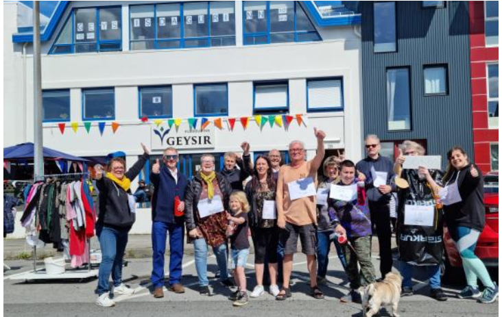
Örþreyttir og órglaðir Örþónspátttakendur skelltu sér í myndatöku