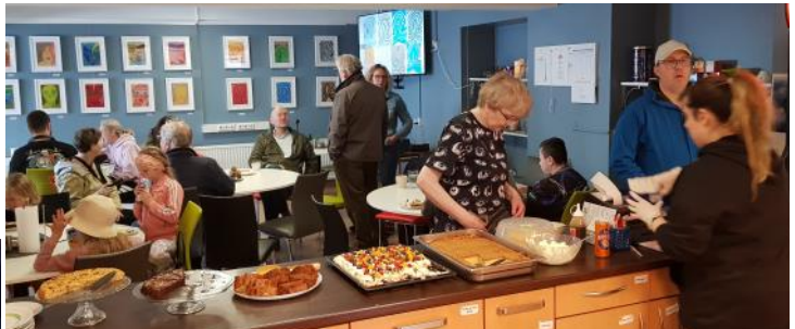
Flottar veitingar að vanda til styrktar klúbbum