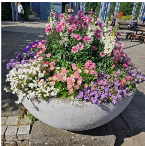
Mynd eftir Krissu Blómahaf og litagleði í kerri

öndina níu ára gömul sem er ótrúlega langur líftími. Ég keypti hana í þeim tilgangi að taka fullt af myndum og gerði ég það nánast uppá hvern einasta dag. Ég hvet ykkur öll til þess að taka myndir, því það er svo gaman að deila þeim með öðrum. Mér finnst líka mjög gaman að taka myndir af hundum og köttum, en þó eru fuglarnir, blómin og trén í aðalhlutverki. Mér finnst líka mjög róandi að taka myndir og gæti ég verið allan daginn að því og hvetur mig mikið áfram. Það er líka smá plús því ég fæ mikla hreyfingu útúr því. Ég bið vel að heilsa í bili !