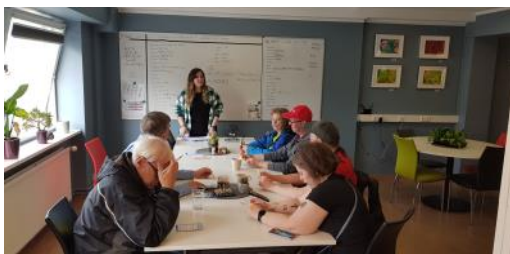
Myndin er tekin á 4. námskeiði Sabelu