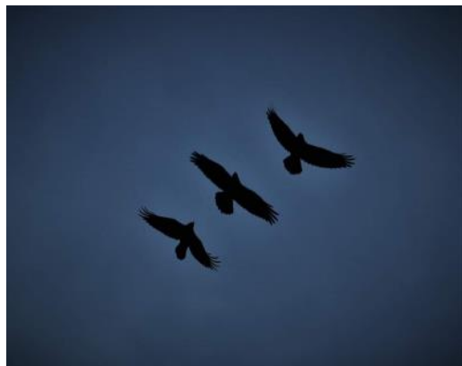
Mynd eftir Krissu: Þrír hrafnar

að taka myndir af snjónum og fallegu trjánum út um hvippinn og hvappinn. Síðasta myndavélin sem ég átti var Canon 1000D og fékk hún nú nýjan eiganda fyrir nokkrum árum og hafði hún reynst mér vel öll þessi ár sem ég hafði hana. Nú og svo fékk ég fréttir af því að vélin var nýlega búin að gefa upp