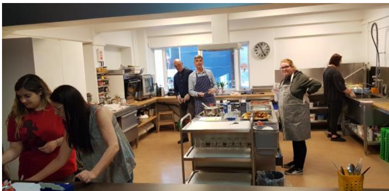
Myndin sýnir undirbúning hádegisverðar í Klúbbnum Geysi

Alþjóðlegur geðheilbrigðisdagur er alla jafna helgaður vitundarefningu fólks sem stríðir við geðrænar áskoranir og ekki síður hinna sem um veröldina ganga án veikinda-merkimiðans. Þar á vagni er og baráttan gegn fordómum og mismunun.