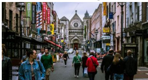
Dublin.