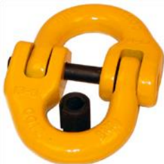
Hér er mynd af einni tegund patentlása

Saga ein gekk lengi meðal sjómanna og var tengd ónafngreindum skipstjóra: Hún er á þessa leið. Í dauðaleggnum, sem kallaður var, var keðja og var hún orðin nokkuð slitin. Dauðaleggurinn liggur frá gröndurum (botnvírum) og í toghlerana. Þegar búið er að hífa er lásað úr hlerunum og tengdur í leiðarana sem hífðu inn trollið. Skipstjórinn tímdi ekki að skipta um keðjuna sem var orðin mjög slitin en lásaði hana alltaf saman með svokölluðum patentlás. Þessir lásar voru mjög dýrir og menn spöruðu frekar við sig að kaupa slíka lása. En skipstjóri þess eins og áður segir skipti aldrei út keðjunni heldur bætti alltaf patentlásum við, þannig að keðjan var ekki lengu keðja heldur röð patentlása.