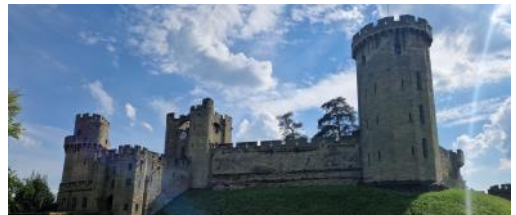
Warwick kastali á miðengaldni frá 14. öld