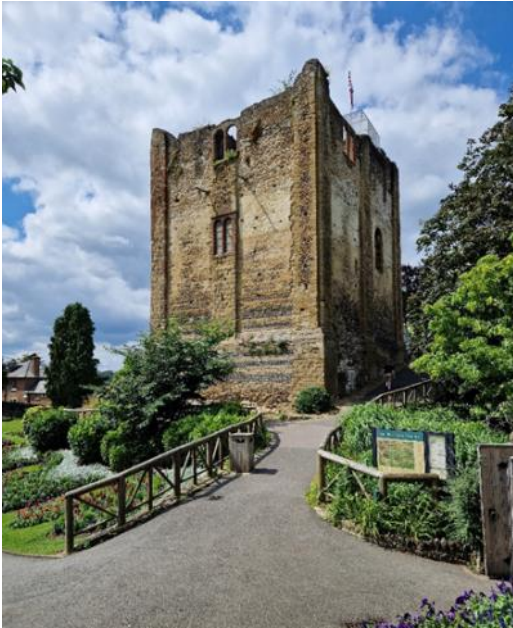
Guildford Kastali á Suður Englandi. Hann er dæmi um kastala frá 12. öld