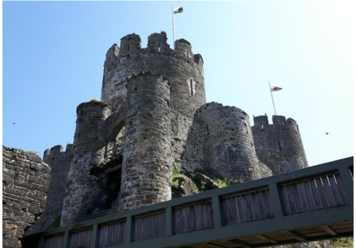
Conwy frá 13. öld sem er frá gullöld kastalatímabilsins í Wales og reistur af Játvarði fyrsta

Með barnaefni frá því ég var krakki og sá sjónvarpsefni um þetta tímabil frá 9. öld til 16. aldar og telur um 700 ár. Einnig á ferðalögum með fjölskyldunni um Spán og Portúgal þar sem við heimsóttum og skoðuðum kastala í þessum löndum. Það er svo mikill menningararfur og svo lifandi í Suður-Evrópu þar sem úir og grúir af byggingum frá þessum tíma ekki síst