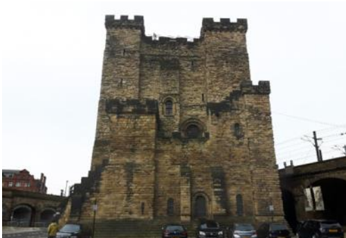
Newcastle turn í Newcastle reistur af Hinriki öðrum á 12. öld