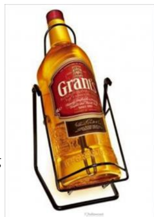
Þetta er reyndar 4,5 lítra flaska og önnur tegund en áhöfnin drakk.

Við vorum alltaf að bíða eftir skipstjóranum sem sem hafði lent í einhverju kvennafari um nóttina. Félagar mínir hvöttu mig til þess að leggja úr höfn og skilja kallinn eftir, en ekki varð af því. Hann var hins vegar að koma um borð þegar við vorum búnir að ákveða að fara upp í bæ og fá okkur að borða. Skipstjórinn var eitthvað að mótmæla því en við hlustuðum ekkert á hann og héldum okkar striki með að fá eitthvað í svanginn. Skipstjórinn hins vegar skömmustulegur í ljósi fyrri yfirlýsinga.