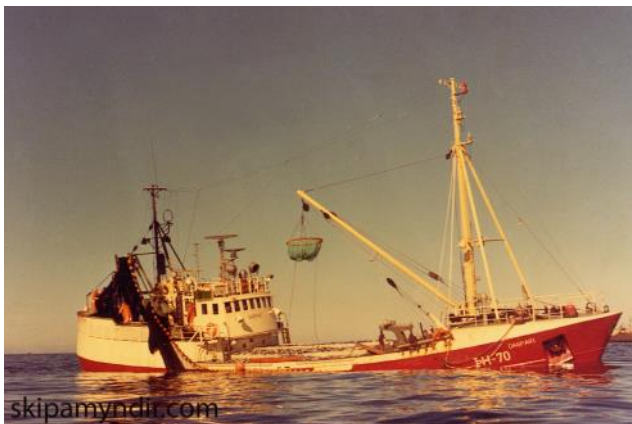
Dagfari HP 25

Aðeins til að segja frá grallaraskap manna og gamansemi þá birtist allt í einu einn úr áhöfn Dofrans í kírauga Dagfara. Hann var með sigarettu í kjaftinum og spurði: „Strákar eigiði eld“. Sumarið eftir rétt fyrir Verslunarmannahelgi var ég á Viðey RE og á leiðinni út á sjó þegar ég var að skoða bankabókina mína. Þá er búíð að leggja inn á mig nokkuð væna upphæð sem jafngilti