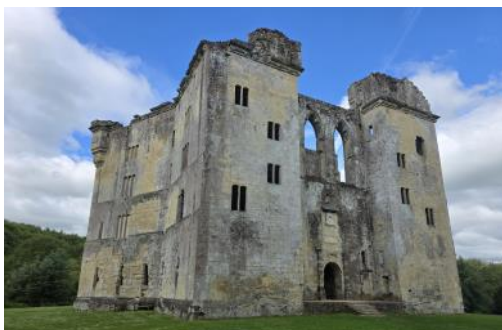
Old Wardour Castle

Stonehenge er um 3500 ára gamalt mannvirki og ekki vitað í hvaða tilgangi það var reist en er talið reist á steinöld Algengasta skýring er að það hafi verið reist til að fylgjast með árstíðum og gangi himintunglanna um festinguna,