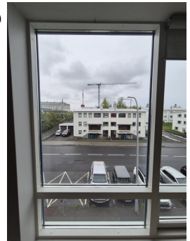
Útsýnið að framan

Forsíðumyndin að þessu sinn er tekin út um gluggan á þriðju hæð Geysis. Frekar gráleit mynd í upphafi sumars en við erum þolinmóð og bíðum eftir að sólin láti sjá sig enn á ný. Hitt er annað mál að miklar framkvæmdir eru í gangi eins og sjá má á fjölda byggingakrana í bakgrunni, svo einhver glæta er í efnahagnum.